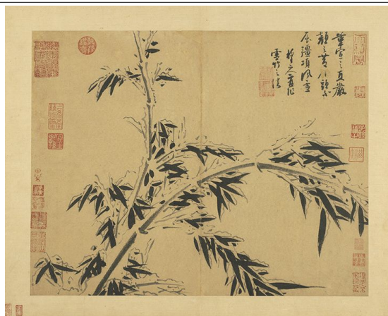
Peinture de Wu Zhen, XIV e siècle

Dans la Chine ancienne, le bambou représentait « l'été », période de l'année où il atteignait son plein épanouissement. Les autres saisons étaient représentées par l'orchidée pour le printemps, le chrysanthème pour l'automne et la fleur de prunier pour l'hiver.