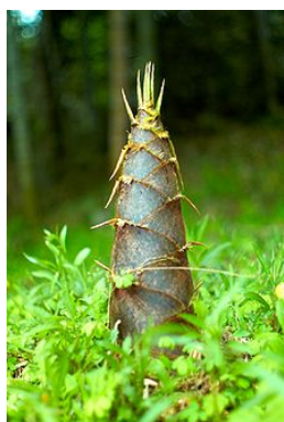
Le turion, jeune pousse