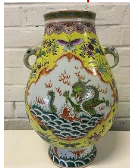
Règne de Shunzhi 1644 - 1661