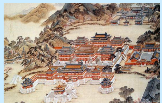
Le Yuanmingyuan, magnifique Palais d'été des Qing est saccagé par les anglo-français. Gouache. Bibliothèque Nationale de Paris.

1911 : les partisans d'une nouvelle révolte prennent le pouvoir à Pékin forçant Puyi, le dernier empereur, à l'exil. Fin de la dynastie Qing !