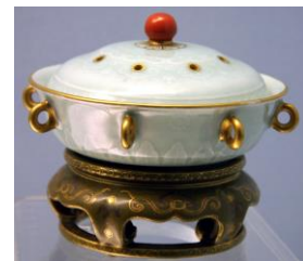
Coupe couverte Règne de Qianlong 1735 - 1796