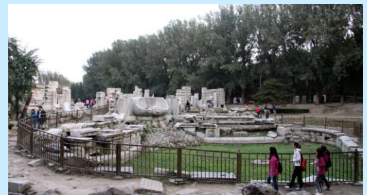
Les vestiges du Yuanmingyuan saccagé par les anglo-français.