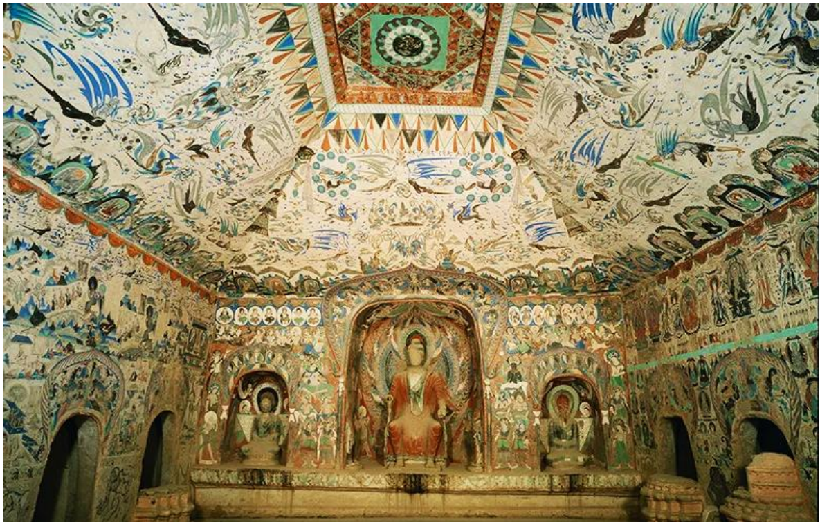
Intérieur d'une grotte de Mogao