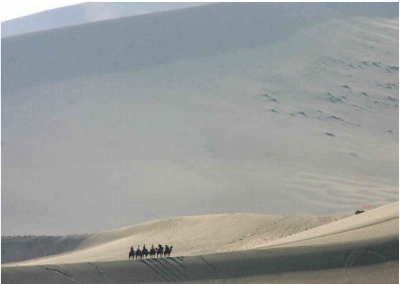
Désert de Gobi : dunes de sable des environs de Dunhuang