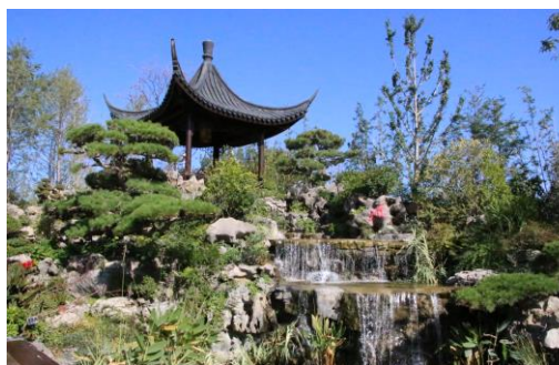
Jardin du Zhejiang