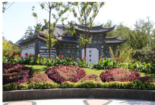
Jardin du Yunnan