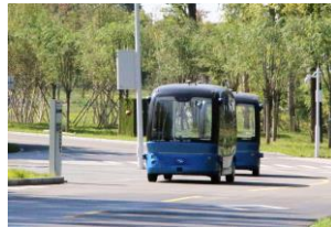
Véhicules électriques autonomes pour aller chercher ou transporter les visiteurs