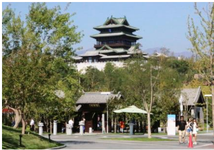
Entrée sur le site de l'Exposition