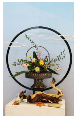
Le Pavillon international présente les caractéristiques des différents pays, dans l'esprit « d'enrichissements mutuels. » Ces quelques compositions en témoignent