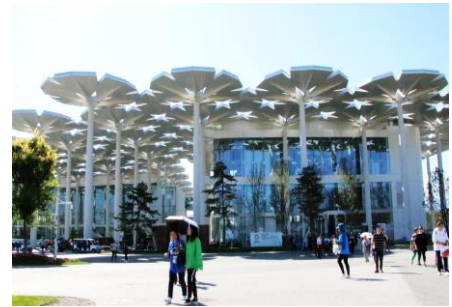
Entrée du Pavillon International