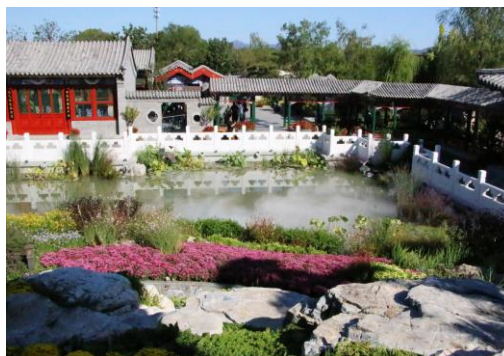
Jardin Hutong de Beijing