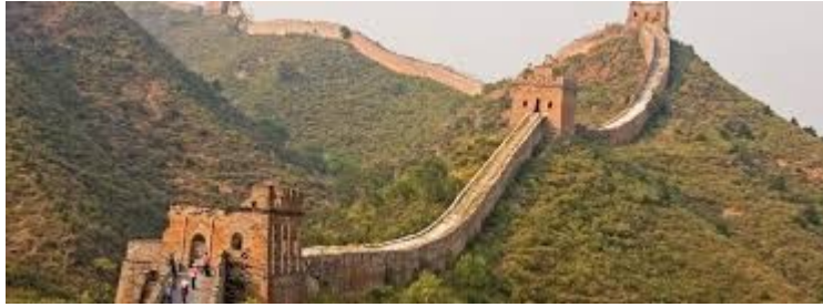
La grande muraille