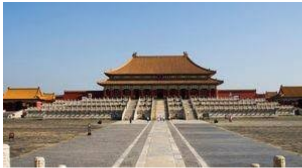
La cité interdite de Pékin