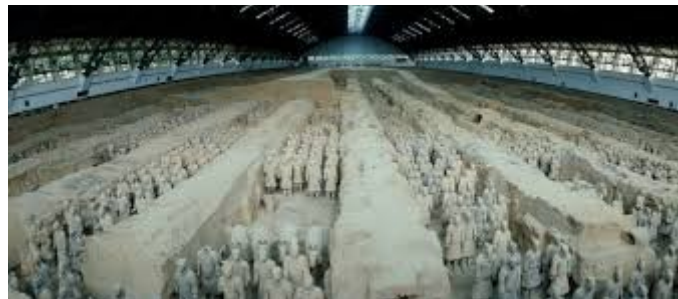
L'armée en terre cuite du premier empereur