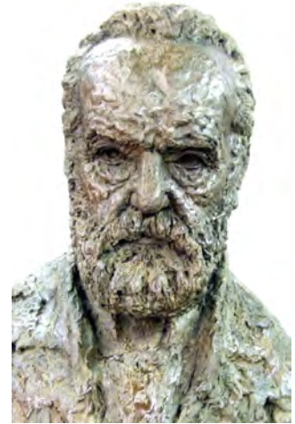
le buste en bronze

Le buste de Victor Hugo installé en l'espace culturel de l'Académie du Théâtre 8 mai 2014