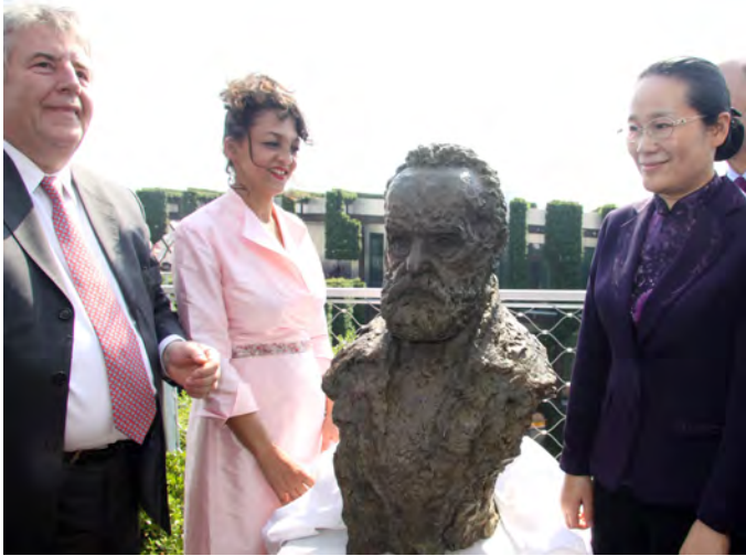
Le Maire de Besançon, l'artiste, la Vice Maire de Shanghai

Les bustes offerts sont ceux de deux Français Molière et Hugo ; de deux Allemands Goeth et Brecht ; d'un Norvégien Ibsen ; d'un Italien Goldoni ; d'un Indien Kalidasa ; d'un Américain Gladstone O'Neil et celui d'un Russe Gogol.